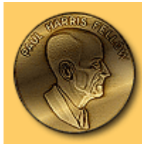
Presidentes de Rotary International Convenciones anuales