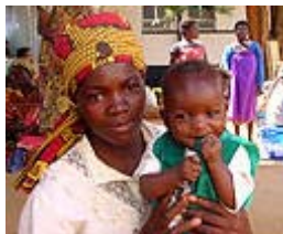
Mail list Matching Grants 2006-2007

satisfacción de este equipo de cirujanos y personal sanitario.