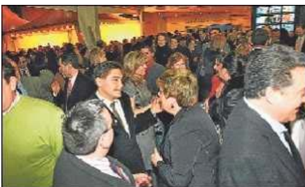
A la izquierda, el salón de actos repleto de público durante la entrega de los premios del pasado año, y al lado, un momento de la posterior velada en los jardines

El diario INFORMACION celebra el próximo jueves en su sede central de Alicante, en la avenida Doctor Rico 17, la gala anual de entrega de los premios "Importantes" a doce personas, colectivos y entidades que destacaron en la provincia por su labor durante 2007 o por su trayectoria profesional o vital. La vigésimotercera edición de estos galardones se iniciará a las 20.30 horas en el salón de actos del Club INFORMACION. En su transcurso los premiados recibirán la ya tradicional escultura obra de Adriano Carrillo.